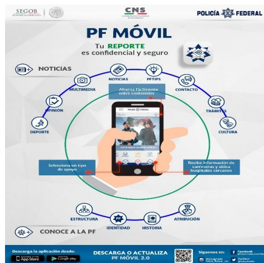
Policía Federal (2018). Aplicación PF Móvil (imagen). Recuperado de https://www.gob.mx/cms/uploads/image/file/439275/PF_movil.jpg