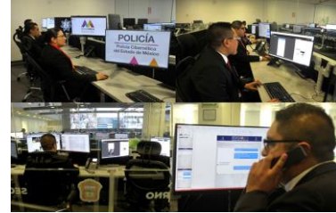
Gobierno del Estado de México. (2018). Policía Cibernética Unidad de Prevención e Investigación Cibernética (imagen). Recuperado de https://sseguridad.edomex.gob.mx/sites/sseguridad.edomex.gob.mx/files/images/penitenciario/Cibernetic

De acuerdo a la autora Citlalli Munguía “ Surge a mediados del año 2000 bajo el mando de la Secretaría de Seguridad Pública hoy denominada Comisión Nacional de Seguridad Pública ” (Zúñiga, 2014) está conformado por un grupo multidisciplinario de profesionistas, capacitados y actualizados continuamente en sus funciones, cuya principal actividad se centra en monitorear la red de internet con fines preventivos, es decir, buscan identificar delitos cibernéticos, algunos como corrupción de menores, pornografía infantil fraude, etcétera; trabajan en coordinación con las instancias federales, locales, municipales y organizaciones que contribuyan al combate y prevención de las conductas y actos criminales.